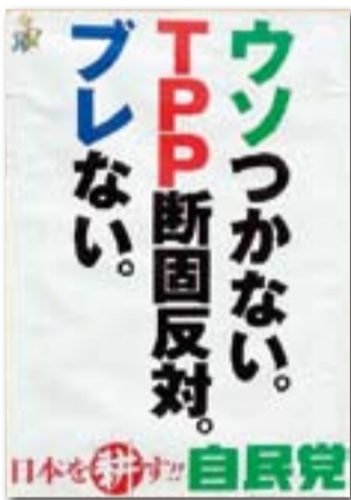
昨年総選挙時の自民党のポスター

例外扱いすることを認めていません。遅れて交渉に参加したメキシコ、カナダは交渉権が制約されています。日本がこれから参加しても「国益」を守ることはできません。